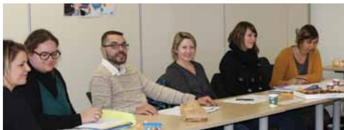
Séance du groupe « Aujourd'hui en arrêt et après ? », le 19 décembre 2016 à Bruz.

Un arrêt de travail prolongé s'accompagne souvent d'un sentiment d'isolement, de difficultés administratives ou d'inquiétudes. C'est pourquoi la MSA Portes de Bretagne a mis en place le dispositif « Aujourd'hui en arrêt et après ? ».