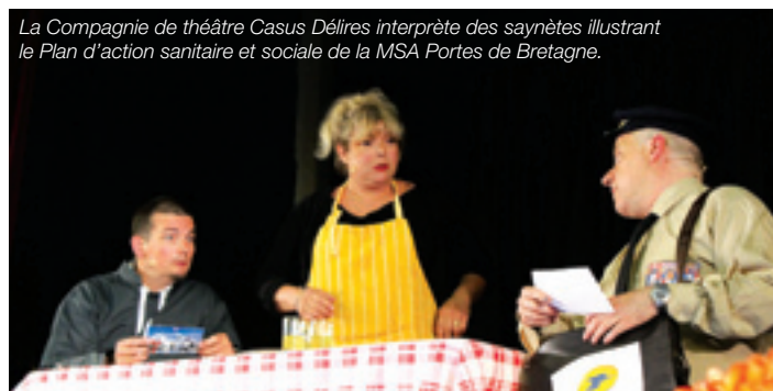
La Compagnie de théâtre Casus Délires interprète des saynètes illustrant le Plan d'action sanitaire et sociale de la MSA Portes de Bretagne.

Au vu des réactions des délégués, nul doute que les messages sont passés et qu'ils sont devenus les ambassadeurs de l'action sanitaire et sociale auprès de leurs pairs.