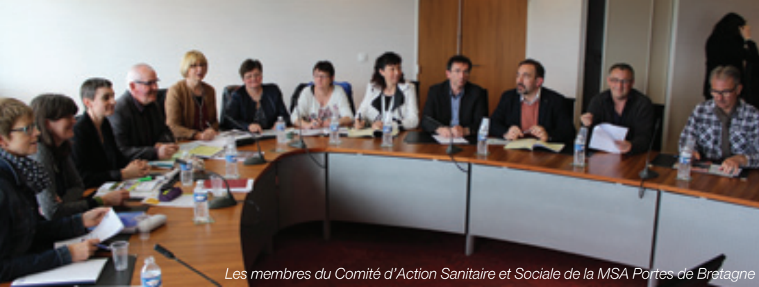
Les membres du Comité d'Action Sanitaire et Sociale de la MSA Portes de Bretagne