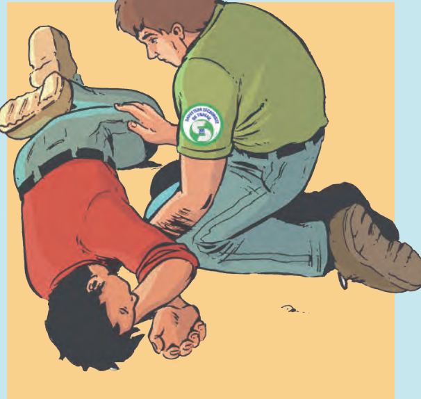
Position Latérale de Sécurité