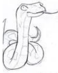
Un agent stressant