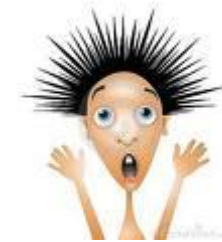
Une réaction de stress