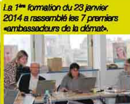
La 1 ère formation du 23 janvier 2014 a rassemblé les 7 premiers «ambassadeurs de la démat».