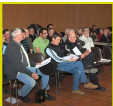
Création des sections cantonales. Des réunions de juin à octobre pour élire les Présidents et Vice-présidents des 44 sections, présenter les missions du Conseil d'Administration ainsi que le rôle de l' élu MSA pour animer son territoire et faire vivre le mutualisme.