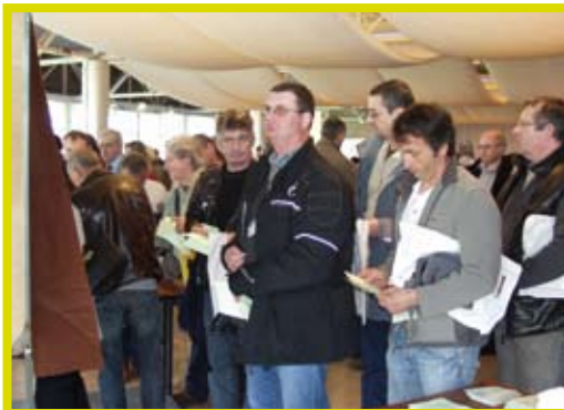
Election du nouveau Conseil d'Administration lors de l'AG électorale du 25 mars 2010.

Elle constitue pour la MSA une année importante comme le sera 2015. Grâce au travail de nos élus, les adhérents de la MSA se sont mobilisés massivement.