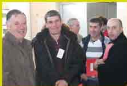
Réunion des présidents cantonaux en mars 2014.